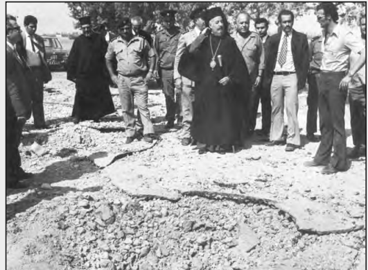
Άλλο ένα από τα "έργα" της ΕΟΚΑ Β'. Ανεπιτυχής απόπειρα δολοφονίας του Προέδρου της Δημοκρατίας, Αρχιεπισκόπου Μακαρίου, λίγο έξω από τον Άγιο Σέργιο Αμμοχώστου, στις 7 Οκτωβρίου 1973. Οργανώθηκε από τον Κίκη Κωνσταντίνου, τομεάρχη της ΕΟΚΑ Β', ο οποίος, κατά τον Αδ. Χαρίτωνος, δεν παραιούθηκε και βρέθηκε στις γραμμές της ΕΟΚΑ Β'...

Ο κ. Καραγιώργη, όταν έβγαλε τη γλώσσα του περίπατο, δεν διαπίστωσε να ισχυριστεί ότι, οι αγωνιστές της ΕΟΚΑ του 1971-74 "παραιούθησαν". Ερωτά: Από ποιον παραιούθησαν; Βέβαια, αν δεχθούμε την ύβρη του κ. Καραγιώργη σαν αληθινή, η απάντηση είναι ασφαλής και μία: Από τον Διγενί. Ερωτά και πάλι και πρέπει να απαντήσετε. Ήταν στο ήθος του Διγενί να εξαπατά και να παραιούει ανθρώπους και προπαντός τους αγωνιστές; Και να τους παραιούει σε τι; Και κάρη ποιόν συμφέρωνταν; Διότι του; Της στρατιωτικής Κυβερνήσεως ή ξένων κυβερνήσεων, για να γίνει από "Άξιος της Πατρίδος", προδότης της Πατρίδος, όπως τον θέλουν οι χολερικοί εχθροί μας; Αν δεχθούμε ότι "παραιούθηκαμε" δεν φτύνουμε μόνο την ιστορία μας. Φτύνουμε και τον νου και την αξιοπρέπεί μας. Διότι κι αν υποθεθεί ότι "παραιούθηκαμε" κάποιον θερμότητα νεαρού, οι άλλοι όλοι "παραιούθησαν"; Και ερωτά, κύριοι ιθύνοντες των Συνδέσμων Αγωνιστών και του Μελάθρου Αγωνιστών.